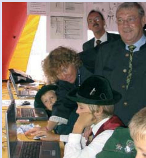
Uczniowie poznają bardziej techniczne szczegóły projektu

W miarę rozwoju projektu dwudziestu nauczycieli i osiemnaście klas z jedenastu szkół korzysta z sieci szkolnej w trakcie lekcji oraz do połączeń między szkołami. Powstało