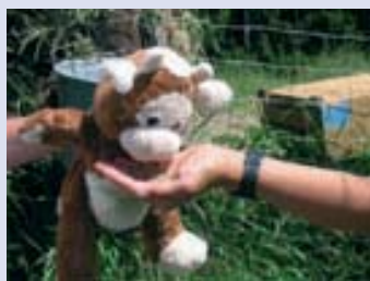
„Samson” inspiruje dziecięcą wyobraźnię

do wiedzy Auerbergland”, w którym szkoły przygotowują pytania na temat historii regionu i wzajemnie na nie odpowiadają. Dzięki temu dzieci lepiej poznają swój region i uczą się korzystać z Internetu. Tur Samson to maskotka, która podróżuje przez cały rok po Auerbergland i służy dzieciom za symbol projektu, który mogą wykorzystać w tekstach i obrazkach publikowanych w Internecie. Także projekt „dziecięce wiadomości” zachęca uczniów do pisanie tekstów zamieszczanych na stronie internetowej. Kolejne przedsięwzięcie „pisanie opowiadań w wirtualnej grupie” pomaga w rozwijaniu umiejętności pisarskich i zachęca dzieci do tej formy wyrażania myśli. W trakcie lekcji dzieci piszą kolejne rozdziały powstającego opowiadania i odczytują je swoim kolegom. Na lekcji omawia się różną wersję historii, po czym wybrana opowieść zostaje spisana wspólnie przez całą klasę i zamieszczona w sieci jako kolejny rozdział opowiadania.